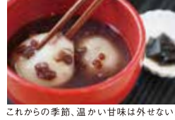
これからの季節、温かい甘味は外せない!