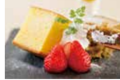
お店オリジナル「玄武洞カステラ」も人気!