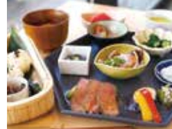
「かご手結び膳」¥2,200 (3日前に要予約)

tel.0796-23-3821 豊岡市赤石 1362 営業 9:00~17:00 (L.O.16:30) 休 年末年始